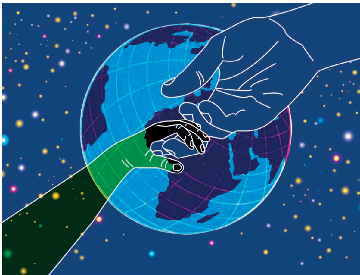
Illustration von Vera Huonker

→ Sonntagsschule während allen Gottesdiensten (ausg. Schulferien)