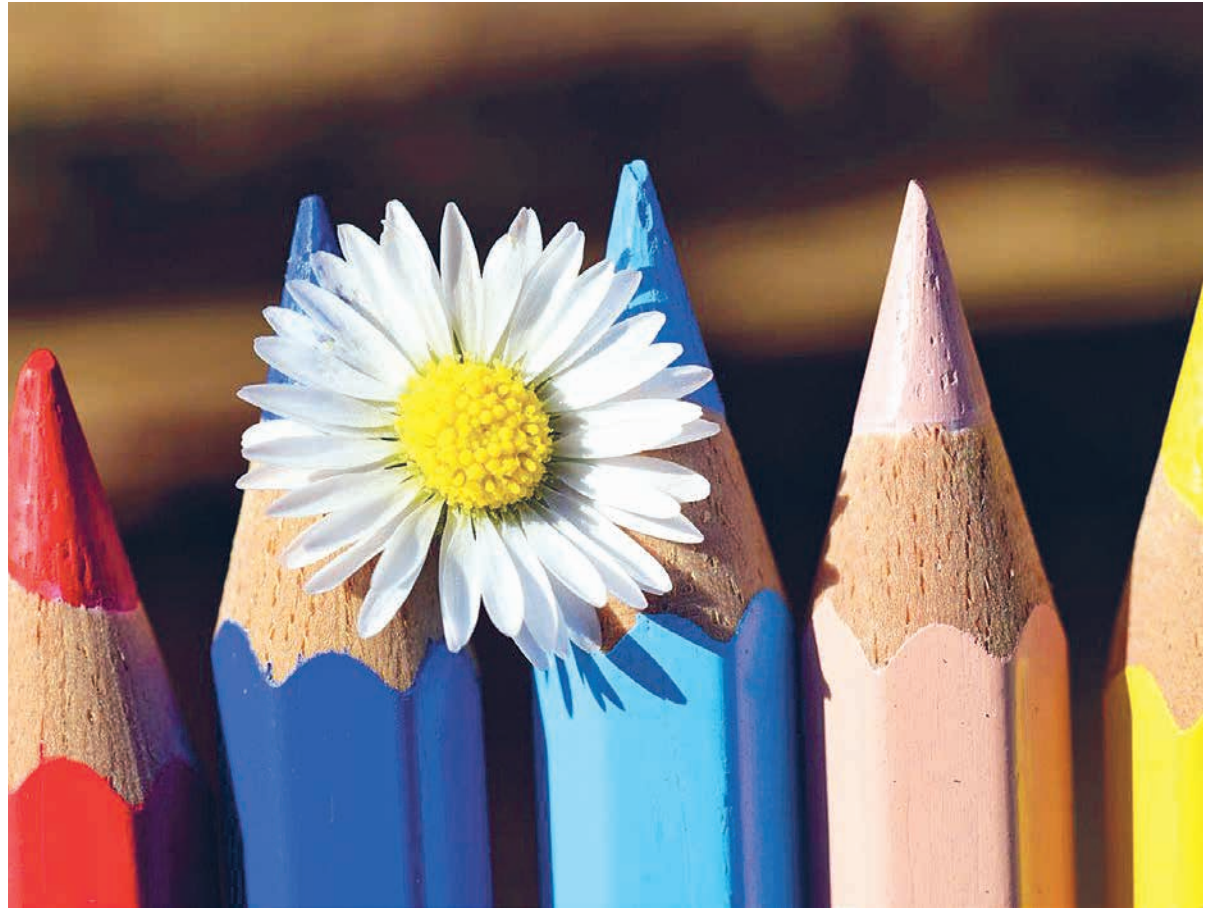
Zur Schulvorbereitung gehört auch das Farbstiftspitzen.

Es handelt sich hierbei um eines der beiden Lieder Huldrych Zwinglis, die bei uns im Gesangbuch zu finden sind. Das Lied stammt aus der Zeit der Kappeler Kriege, bei denen Zwingli selbst als Feldpredi- ger dabei war. Die Soldaten sangen das Lied bei Kappel: «Herr, nun heb den Wagen selb, schelb wird sust all unser Fahrt.» Ein starkes Gebet in grosser Gefahr, eine Bitte um Bewahrung des Glaubens und der Einheit der Eidgenossen- schaft.