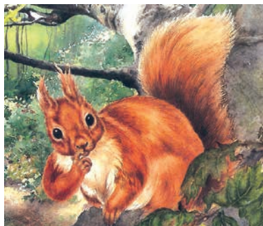
Das Eichhörnchen, Klara Knusper